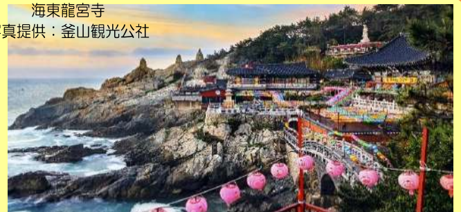
海東龍宮寺