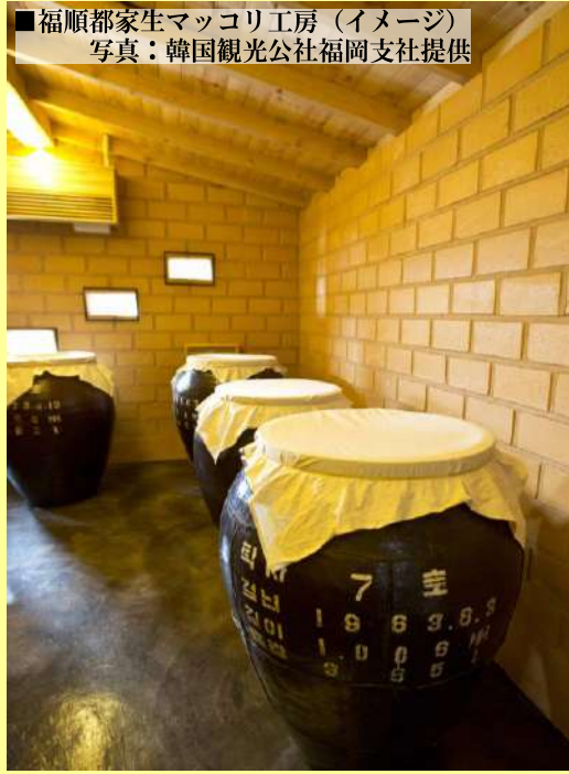
■福順都家生マッコリ工房 (イメージ)

企画者よりコメント これまでマッコリは苦手だったのですが、 ここのマッコリをお土産で戴いてから こんなに美味しかったの?? もっと早く知っておきたかった!!