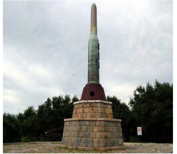
二〇三高地(爾靈山碑)