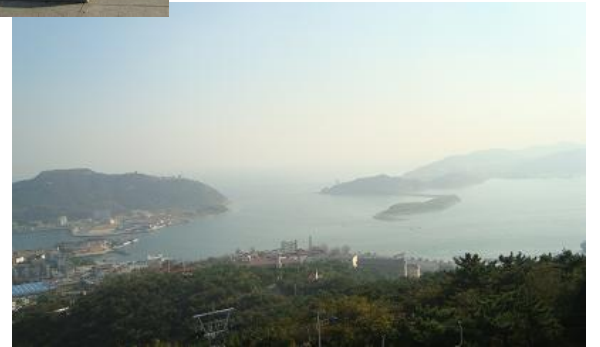
白玉山より旅順口を望む