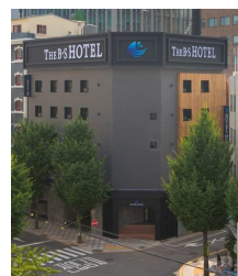
こじんまりしたホテル ご予約はお早め！

各部屋には快適なシャワーブース完備！ (ドライヤー・バスローブやシャンプー・ボディソープなど揃っています)