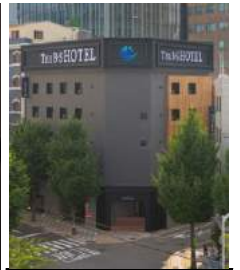
こじんまりとしたホテル ご予約はお早めに！

各部屋には快適なシャワーブース完備！ (ドライヤー・バスローブやシャンプー・ボディソープなど揃っています)