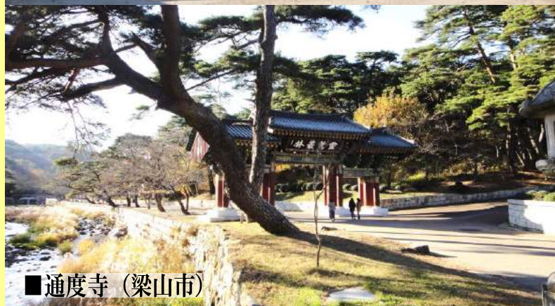
■ 通度寺 (梁山)