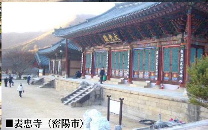
■ 表忠寺 (密陽)

【旅行代金に含まれるもの】関釜フェリー2等往復運賃(船内宿泊)/食事3回/現地移動費(現地は当ツアーグループでの移動となります。)/旅行特別補償保険料 ※すべてツアー内指定分に限り、【最少催行人員】8名様【添乗員】同行しません。現地日本語係員がご案内します。 【子供代金(6歳以上12歳未満)】大人と同額 【幼児代金(1歳以上5歳以下)】大人1名につき1名 12,000円