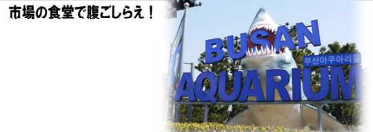
市場の食堂で腹ごしらえ！