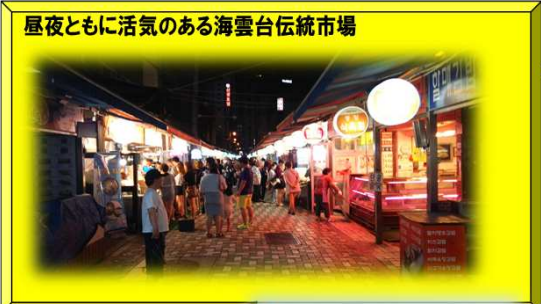
昼夜ともに活気のある海雲台伝統市場