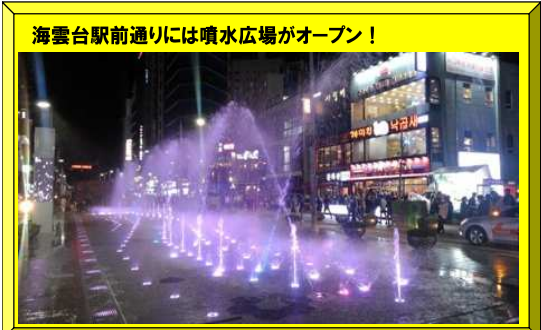
海雲台駅前通りには噴水広場がオープン！