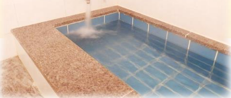
(館内大浴場「大衆湯」もご利用いただけます)