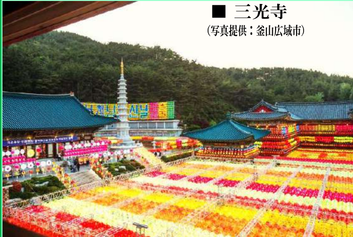
■ 三光寺 (写真提供：釜山広域市)

■個人旅行で行くには難易度が高いところをウォーキングで楽しみ リフレッシュ！ フォト&ウォークツアー開催中に撮影した写真を当社へご提供ください！（詳細は裏面）