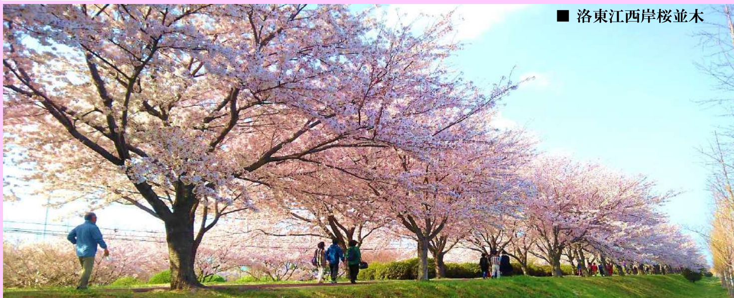
■ 洛東江西岸桜並木

■個人旅行で行くには難易度が高いところをウォーキングで楽しみ リフレッシュ！ フォト&ウォークツアー開催中に撮影した写真を当社へご提供ください！(詳細は裏面)