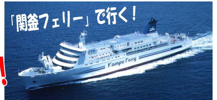
「関釜フェリー」で行く!

韓国料理に息づく「薬食同源」「もてなしの心」を表現した、内容豊かな郷土料理です。品数の多さにもおまわず嬉しくなります。