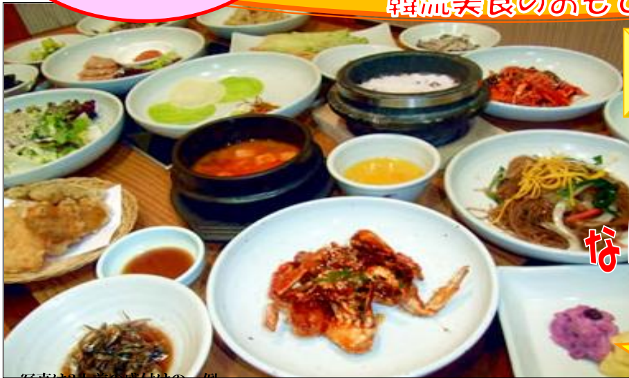
写真は3大前の盛付けの一例