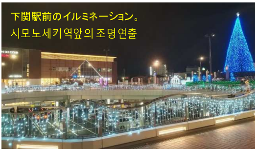
下関駅前のイルミネーション。 시모노세키역앞의 조명연출

アクセス: 下関港より下関駅方面に徒歩7分 시모노세키항에서 시모노세키역 방향에 도보10분.