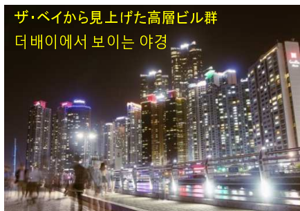
ザ・ベイから見上げた高層ビル群 더베이에서 보이는 야경

アクセス: 釜山地下鉄2号線「冬柏駅」より徒歩10分 부산지하철2호선 동백역에서 도보10분