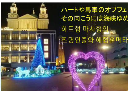
ハートや馬車のオブジェ。 その向こうには海峡ゆめタワー 하트형 마차형의 조명연출와 해협유메타워.