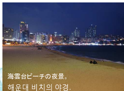
海雲台ビーチの夜景。 해운대 비치의 야경.