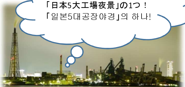
「日本5大工場夜景」の1つ！ 「일본5대공장야경」의 하나!