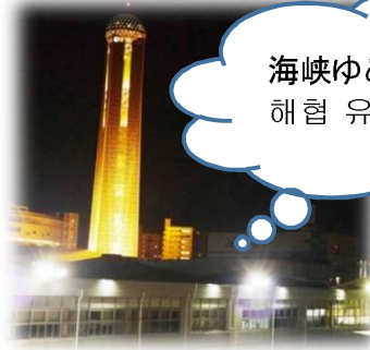
海峡ゆめタワー(153m) 해협 유메타워