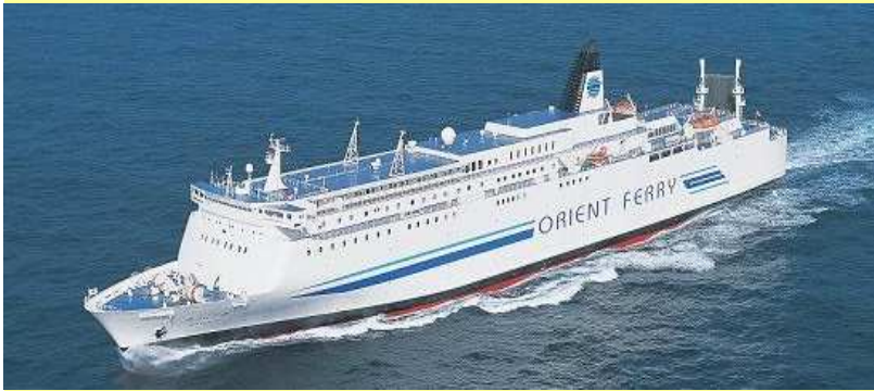
オリエンツフェリー「ゆうとぴあ」 ●全長:184.5m ●総トン数:26,906t ●航海速力:22.6knot(約42km/h) 船内では安心の日本語対応OK、通貨も日本円、コンセントも日本仕様。

【グループ特典】※6名様以上でお申し込みの場合 中国国内移動は専用車(貸切)でご案内します。 かつ、旅行代金をお一人様あたり 8,000円割引致します。