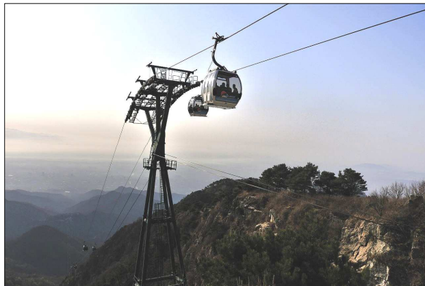
“泰山”ではロープウェイを利用します。