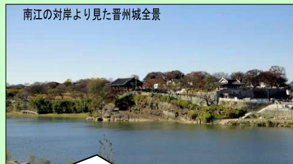
南江の対岸より見た晋州城全景 晋州城は美しい南江に面しています。このツアーでは、午後に対岸約1.2kmのウォーキングをお勧めします。