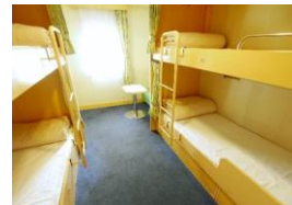
1等室 洋室 (4名)