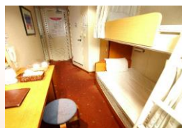
1等室 洋室 (2名)