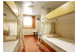
1等室 洋室 (4名)