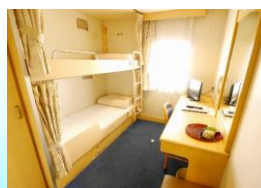
1等室 洋室 (2名)