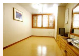
1等室 韓室 (4名)