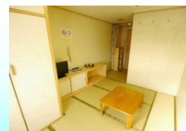
1等室 和室 (4名)